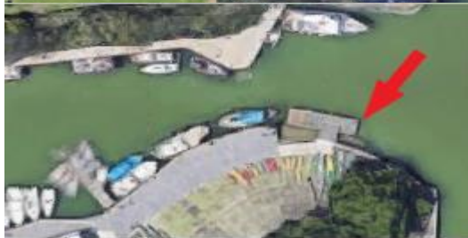
ACCESO POR AGUA SÁBADO 22 DE ENERO