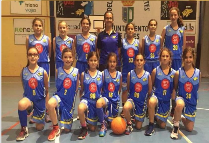
SLOPPY JOE'S CD GINES BALONCESTO