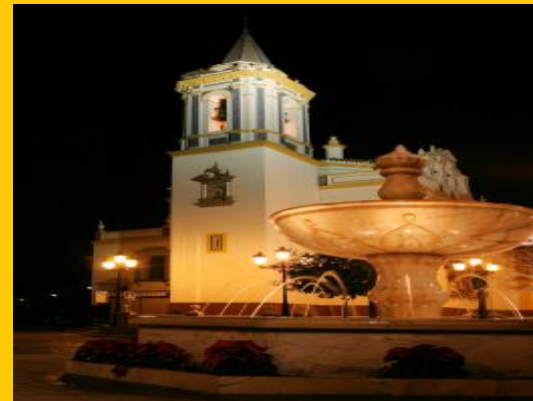
IGLESIA SANTA MARIA