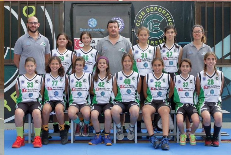
CLUB DEPORTIVO CAREBA