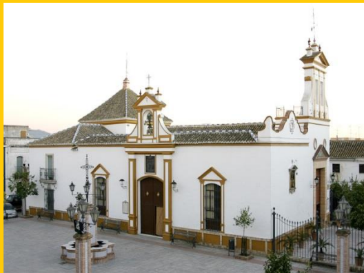
HERMITA Nª Sª de BELEN