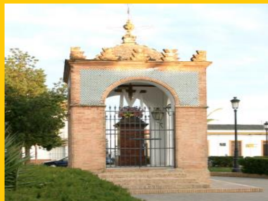
Sta. Cruz HUMILLADERO