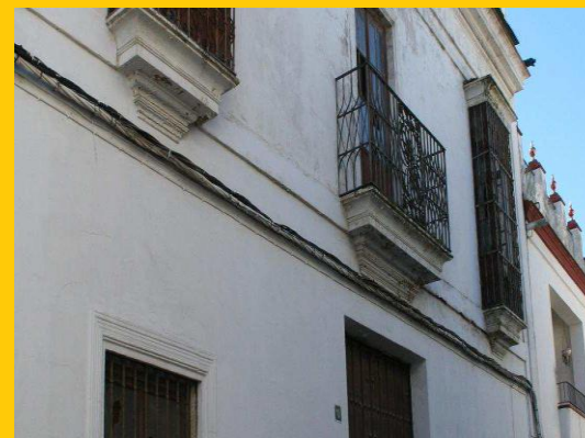
CASA JUAN DE LA ROSA