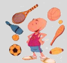
C.D. TOR DEL REY