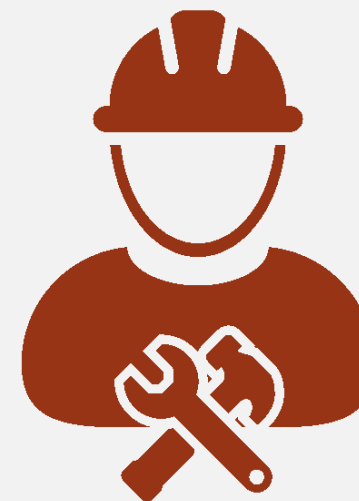
Gestión de Proyectos