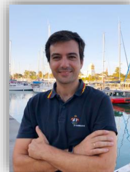
Pablo Fernández Palacios Comodoro