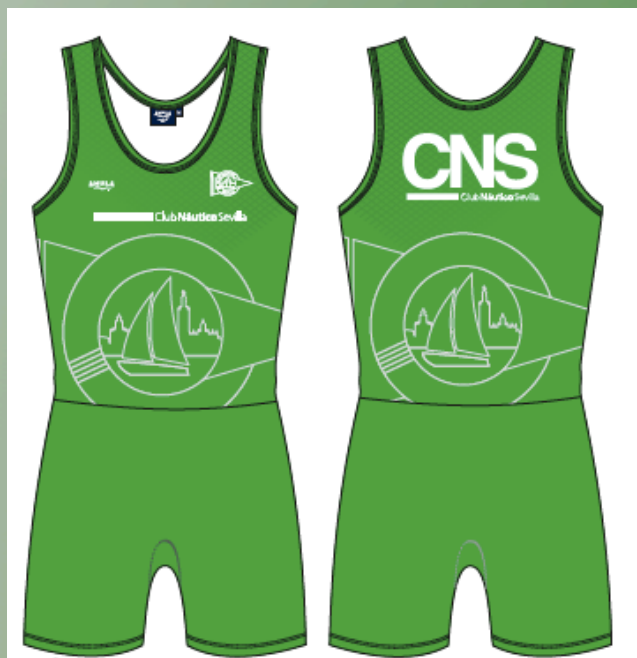
Platanito Semitrans LNI (Escuelas, Alevines, Infantiles y Cadetes) 36,50€ IVA Incluido