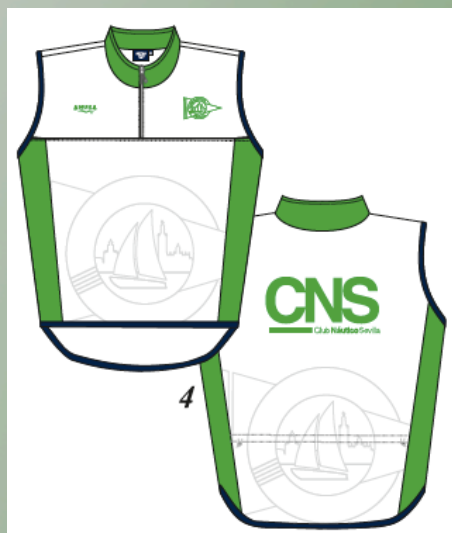
Chaleco Termo Full Trans Remo 41€ IVA Incluido