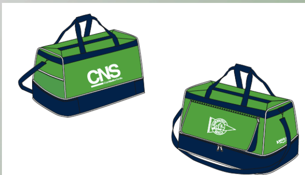
Bolsa de Viaje 36€ IVA Incluido