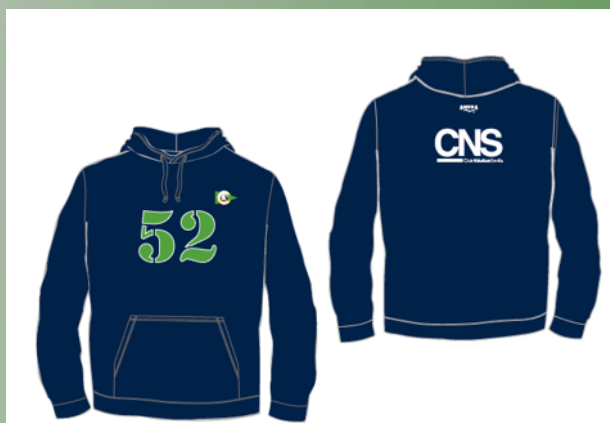
Sudadera de Algodón 28,50 € IVA Incluido